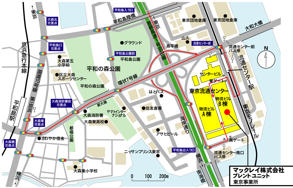
東京流通センター物流ビルB棟